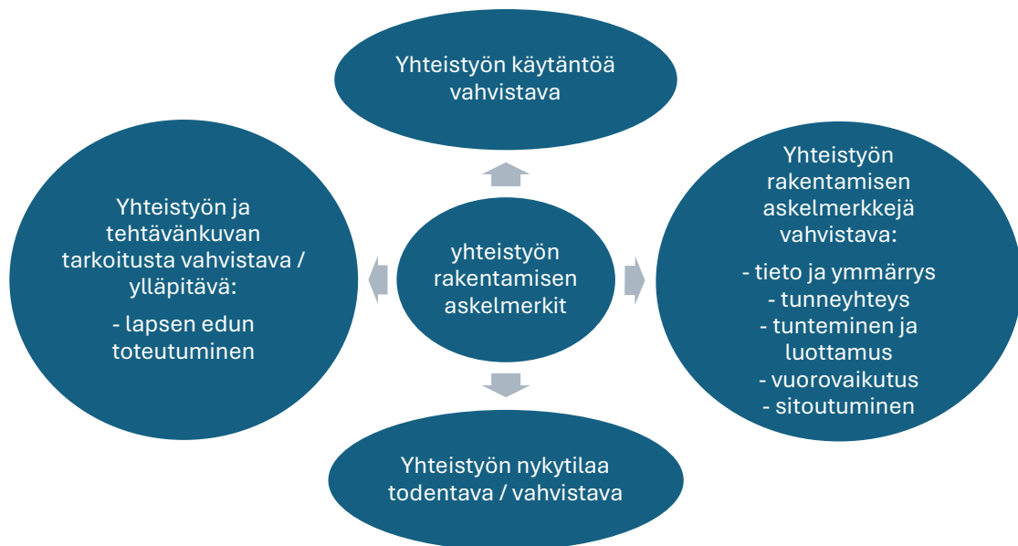
Kuvio 2. Yhteistyön rakentamisen askelmerkeistä saatu hyöty.