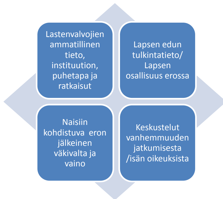
KUVIO 2. Aineiston analyysiä ohjanneet näkökulmat

Vaikka tutkimuksessa korostuu aineiston perusteella viranomaisten näkökulma, on siinä lisäksi vainon ja väkivallan uhrien, lasten ja väkivallan tekijöiden näkökulmat. Eri-laiset näkökulmat muodostavat analyysin kehysten ja ovat ohjanneet kirjoittamista ja lukutapaani (kuvio 2). Kuviossa 2 tuon esille näkökulmia, jotka risteilevät lastenvalvoji-en ammattillisessa katseessa väkivallan ja vainon tilanteissa. Kehys kuvaa aineiston lu-kutapaani, mutta se tuo esille myös lastenvalvojen työn moninaiset vaatimukset. Tut-kimuskysymysten ja aineiston vuoksi tekstissä painottuu viranomaisen näkökulma. Kaikki näkökulmat eivät tule esille suorana puheena vaan tekemineni valintojen, ana-lyysin ja kirjoittamisen kautta (mm. Granfelt 1998, Husso 2003).