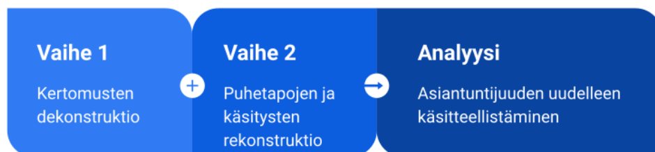
Kuva 1. Tutkimusasetelma